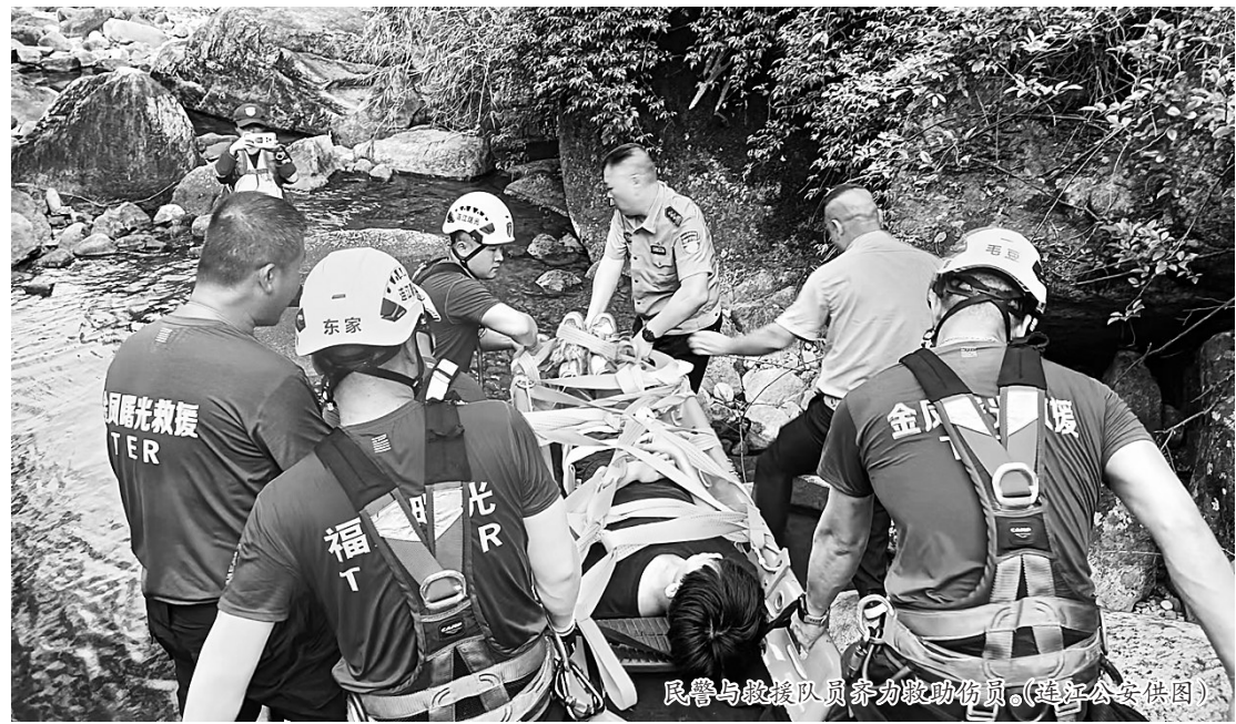
民警与救援队员协力救助伤员。

峰,不手扶铁制栏杆,不在树下避雨;四是注意步行安全,户外运动前要选择舒适的登山鞋、运动鞋和相关装备,登山时做到“走路不看景,看景不走路”,避免跌倒摔伤;五是及时报警求助,登山时应避免单独行动,要备好水和干粮,万一迷路、受伤,不要慌张,应及时报警。