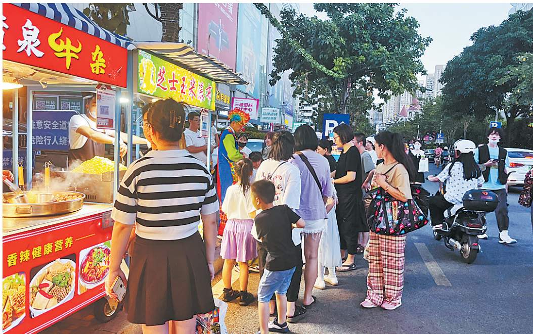
市民游客在夜市购买美食。

滚滚热浪袭来,也为冷饮市场添了一把火。在广达路的一家雪糕批发店,冰柜里摆放着几十种雪糕、冰