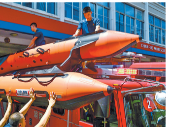
消防指战员装运冲锋舟。

“讯前我们就已经对由6家国企组成的防内涝应急队伍开展了人员培训与设备保养检修工作，确保在排水防涝关键时刻拉得出、顶得上、打得赢。”上述负责人说。 在易涝点及城市重要交通线，人员、设备也提前到岗到位，做好网格化巡查，可随时投入排水防涝战斗。 “讯前我们就已经对由6家国企组成的防内涝应急队伍开展了人员培训与设备保养检修工作，确保在排水防涝关键时刻拉得出、顶得上、打得赢。”上述负责人说。