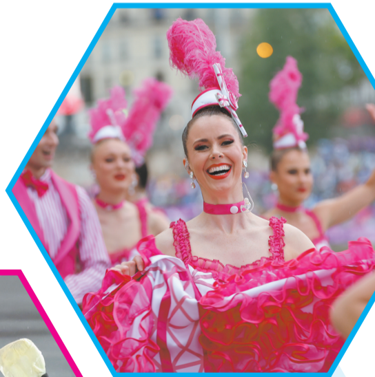
▲演员在奥运会开幕式现场表演。