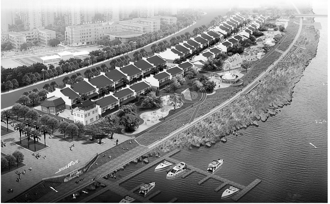
环松山湖公园提升项目效果图。

本报记者(记者 任思言 通讯员 林晋如 刘其燧)“太好了,家门口的公园提升改造了,听说还要建运动场地,今后不愁没地方运动健身了。”8月5日,罗源县环松山湖全民健身设施建设项目(滨海路步道提升项目)开工,这项民心工程让附近居民连连叫好。