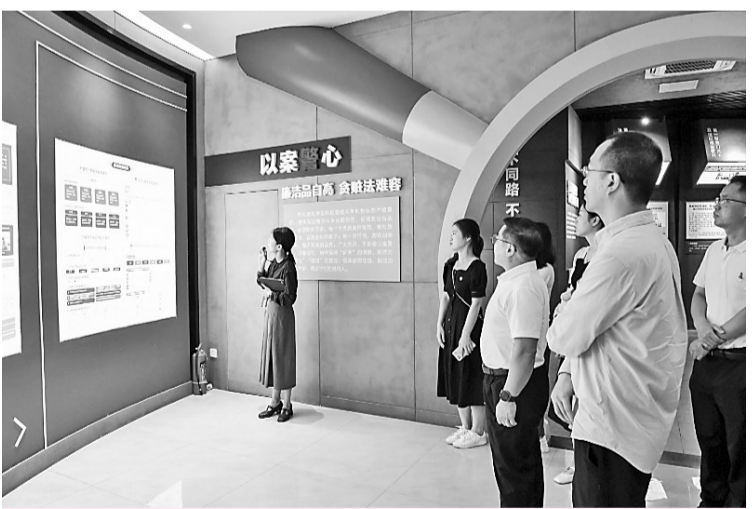
市纪委监委组织纪检监察干部赴仓山区反腐倡廉警示教育基地研学。

6月27日,全市警示教育会召开。会上,市委常委、市纪委书记、市监委主任傅藏荣通报剖析了党的十九大以来我市违纪违法典型案例,以案说德、以案说纪、以案说法、以案说责,参会人员集中观看了市纪委监委拍摄的警示教育