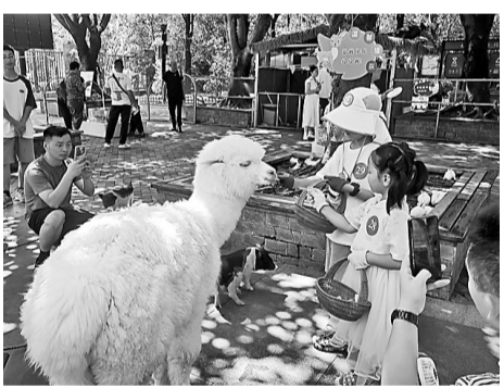
在福州市动物园,军人子女体验萌宠乐园喂食。

据了解,福州市“党建+双拥”联盟以聚力争创全国双拥模范城为目标,大力实施“党建+”系列工程,打破壁垒、盘整资源,使双拥工作逐步向新板块延伸、拓展,持续构建优势互补更加突出、融合联动更加密切的“党建+双拥”新格局。