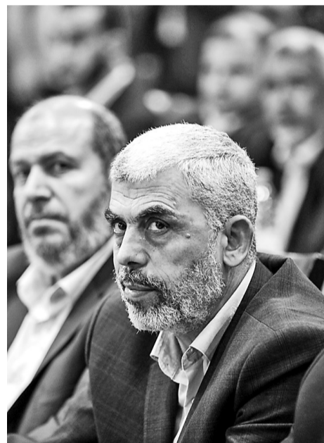
这是2017年5月1日在加沙城拍摄的叶海亚·辛瓦尔(资料照片)。