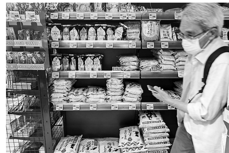
7月26日,在日本东京一家连锁超市,一名男子经过摆放大米的货架。