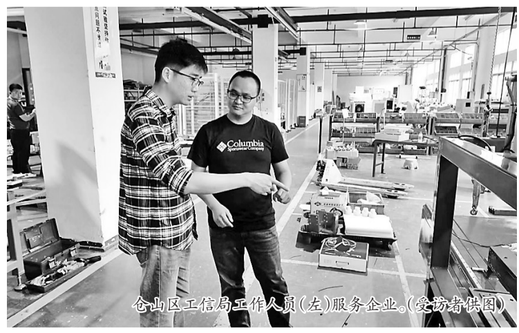
仓山区工信局工作人员(左)服务企业。

用于新能源汽车锂电池的生产制造。继2020年获评福建省级专精特新后,今年,企业申报了国家级专精特新“小巨人”企业。