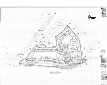
调整后地面车位布置图