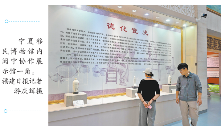
宁夏移民博物馆内闽宁协作展示馆一角。