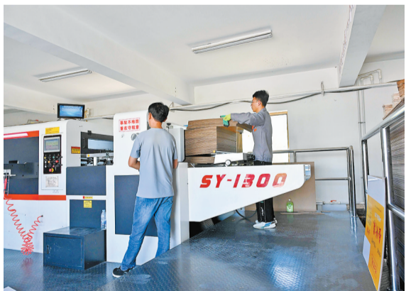
吴忠市红寺堡区弘德村的家庭工厂。

宁夏吴忠市红寺堡区,居住着曾被联合国称为“最适宜人类生存的地区之一”的西海固地区迁移来的20多万名移民,是全国最大的易地生态移民集中安置区。在这里,闽宁协作车间根据年龄、健康状况,为当地群众安排合适的岗位。“以前的‘干沙滩’,变成了今天的‘金沙滩’”