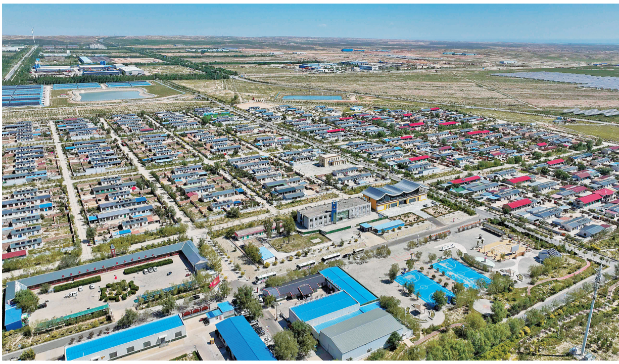
航拍吴忠市红寺堡区弘德村。

8日-13日,“铸牢共同体 中华一家亲”主题宣传“塞上江南写新篇”集中采访活动走进宁夏回族自治区。一个个产业协作唱响“春天的故事”、一次次闽宁文化交融碰撞令人耳目一新、一张张幸福笑脸灿烂绽放……一路上,记者深刻感受着“爱拼才会赢”与“宁夏川,两头尖,天下黄河富宁夏”的合奏曲,一场新时代的“山海情”正在演绎。