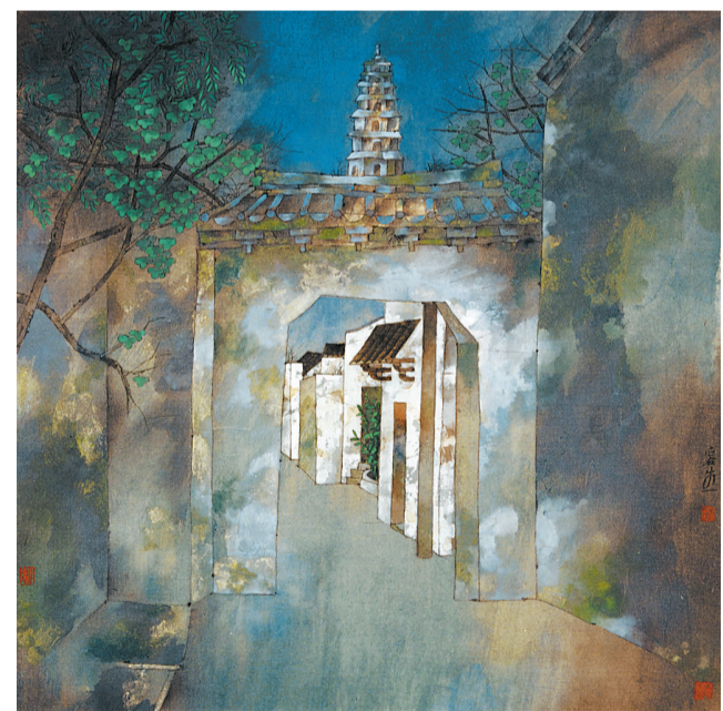
林容生的作品《三坊七巷》。(绢本重彩,40x40cm,2006年)

正如其所言,此时,林容生的青绿山水不单是对现实世界的简单再现,而是像传统的文人画一样,加入了主观情思,是在画青绿,更是在画自我追求。