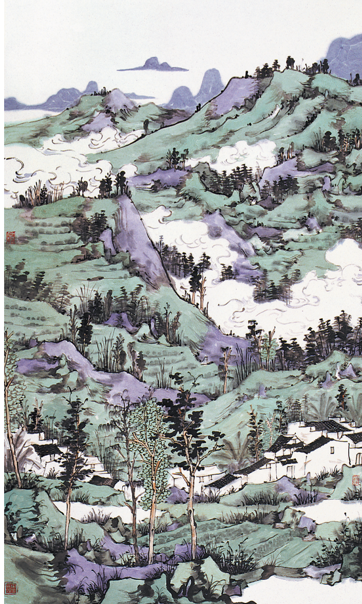
林容生的作品《家园》。(纸本水墨设色,180x96cm,2008年)