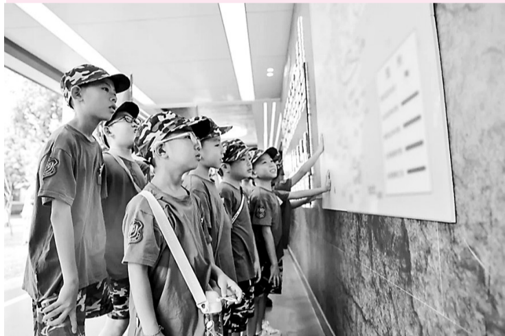
“魁龙少年”志愿宣讲团参加暑期实践活动。