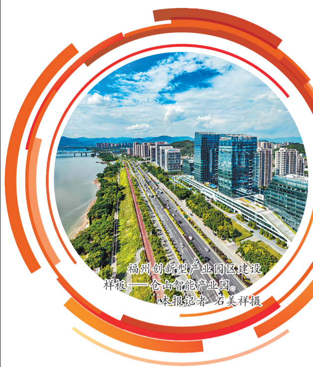
福州创新型产业园区建设样板——仓山智能产业园。