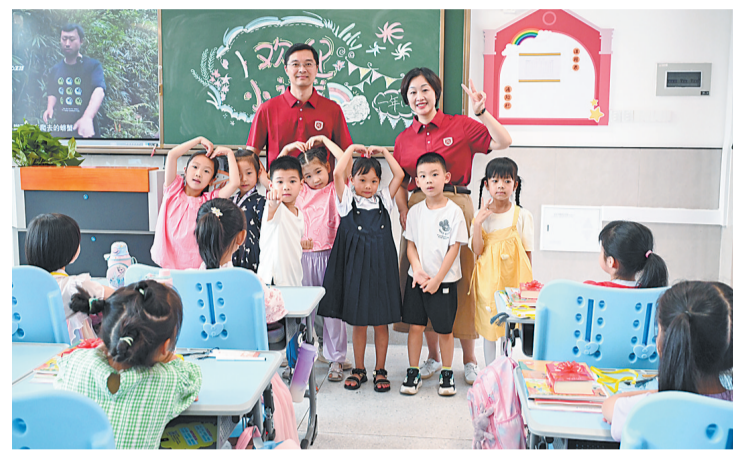
落地仓山的福高小学部今秋投用。

城区大踏步发展,乡村旧貌换新颜。坚持以回购商贸楼等方式发展村集体经济,2023年,全区112村(社区)总收入约5.5亿元,其中年收入100万元以上的村(社区)有97个,11个村(社区)年收入更是超过1000万元,越来越多的居民过上领分红的日子,在医疗、教育、养老等方面还享有补贴,幸福感满满。