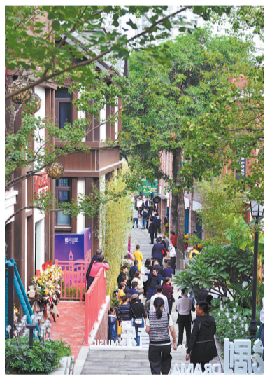
烟台山成为福州商业和文化新地标。

沧海桑田,仓山变了容颜。从金山片区到奥体片区再到三江口片区,开发建设提速再提速,一个个旧屋区不见了,取而代之的是鳞次栉比的高楼大厦、四通八达的交通路网,以及随处可见的公园、绿地等,城市框架全面拉开。