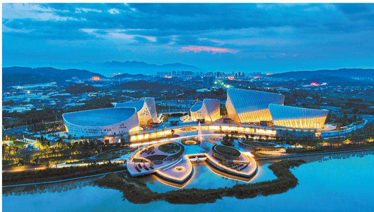
海峡文化艺术中心。

幸福都是奋斗出来的。从昔日的“闭塞郊区”“落后郊区”“破旧郊区”,到今天的“核心之区”“活力之区”“品质之区”,无不跟接续奋斗密切相关。我们有理由相信,仓山的明天一定会更加美好。