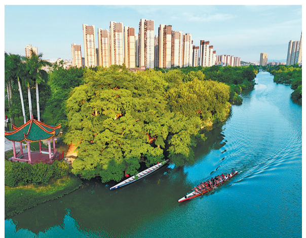
治理后的流花溪美如画。

七十五载奋斗路,如今扬帆再起航。仓山区将深入学习贯彻党的二十大精神,坚定信心决心,践行初心使命,加快建设繁荣美丽开放文明的新时代新仓山,奋力打造现代化国际城市先行示范区。