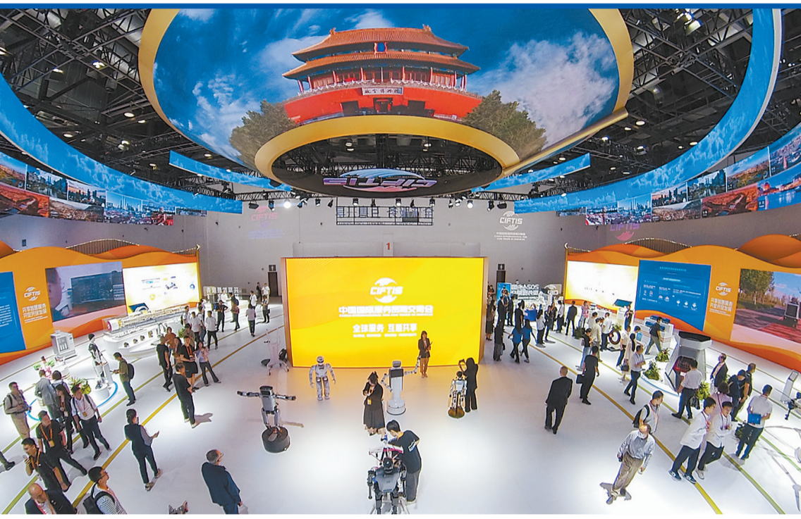
▲9月13日,在服贸会国家会议中心综合展区,观众参观展出的人形机器人。

誉称号;授予路生梅(女)“人民医护工作者”国家荣誉称号;授予张卓元“经济研究杰出贡献者”国家荣誉称号;授予张燮林“体育工作杰出贡献者”国家荣誉称号。