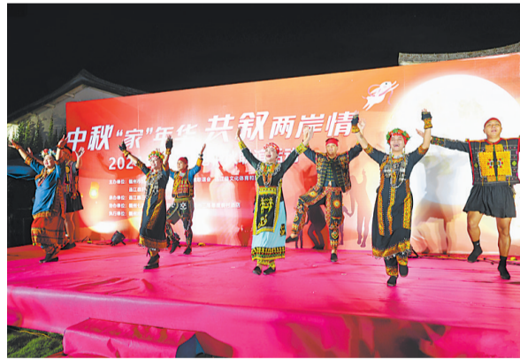
台湾同胞在中秋联谊活动上载歌载舞。(连融媒供图)

参加活动的台青们表示，这次活动让他们真切感受到福建省和福州市对台青的重视和关怀，期待未来两岸青年携手同行，为开创两岸关系的美好未来贡献更多青年力量。