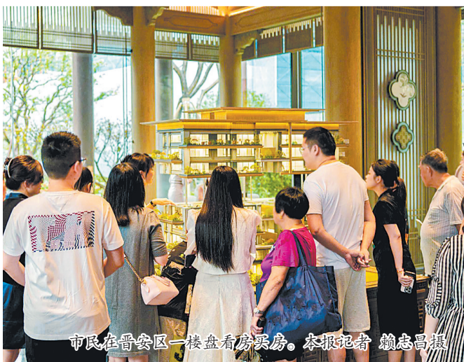
市民在晋安区一楼盘看房买房。

今年以来，福州楼市政策延续宽松基调，陆续推出降首付、降利率、优化公积金贷款政策等举措。在密集利好政策的持续发酵下，刚需和改善性住房需求加速释放。