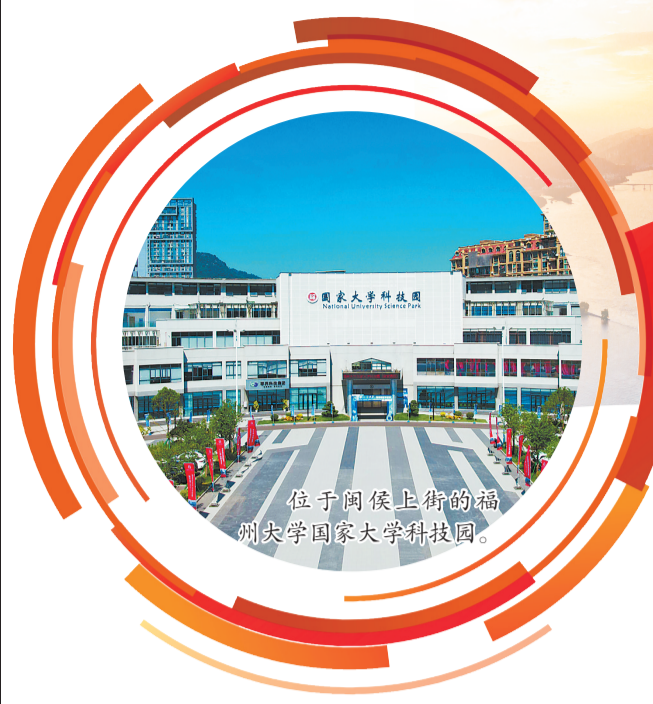
位于闽侯上街福州大学国家大学科技园。