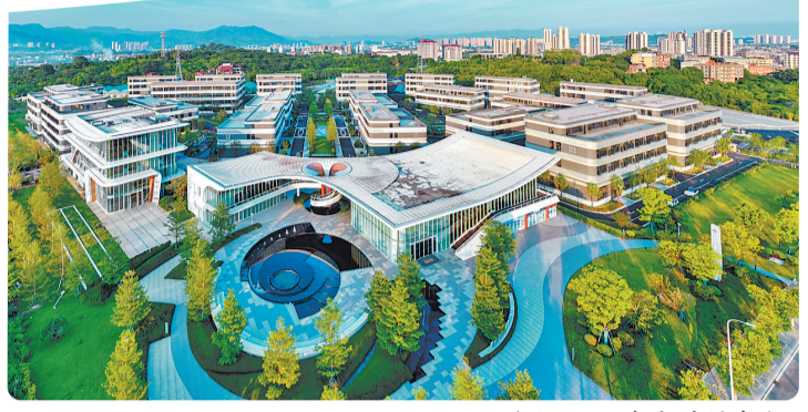
宜居宜业的闽侯滨江新城。

闽侯县还搭建了智慧养老信息平台,设置了24小时呼叫中心,随时为需要帮助的老年人提供“及时雨”。同时,进一步健全探访关爱服务机制,积极落实困难老年人“平安通”全省首批服务试点工作,委托第三方机构按照平均每人每月30元的标准,为本地户籍或持有本地有效居住证的孤寡、独居、空巢、留守、失能、重残、计划生育特殊家庭等七类有探访关爱需求的居家老年人免费安装“平安通”基础服务终端设备,提供紧急呼援、生命状态监测、定位信息等14种线上线下免费基础服务。