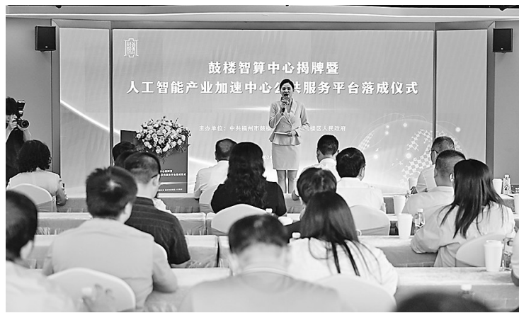
鼓楼智算中心揭牌暨人工智能产业加速中心公共服务平台落成仪式现场。

下一步,鼓楼区将继续坚持“平台支撑、要素赋能、场景牵引、源头培育、辐射带动”,以算力互联互通助力新质生产力发展,以数据融通、开发利用贯穿城市全域数字化转型始终,更好促进数字技术和实体经济深度融合,打造人工智能集聚区和创新高地、数字应用第一区。