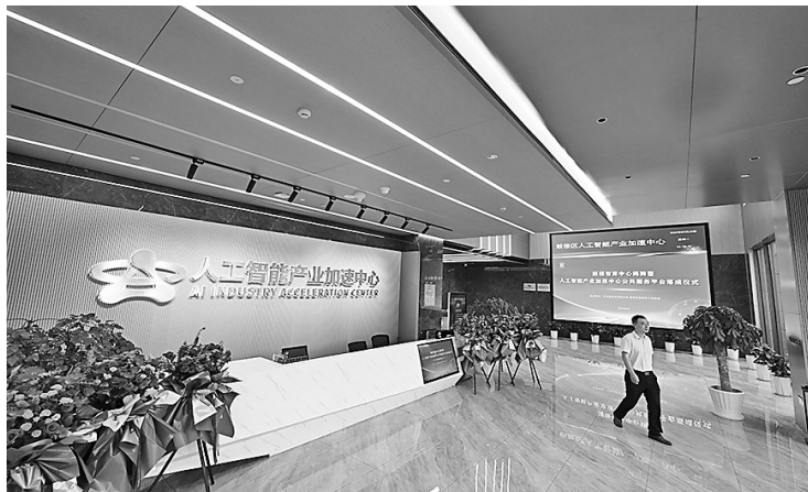
鼓楼人工智能产业加速中心。