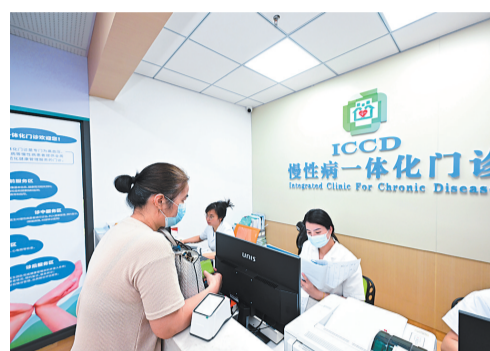
义洲街道社区卫生服务中心内,就诊市民在慢性病一体化门诊咨询。

医疗强基层,人才是关键。为进一步充实乡村医疗卫生人才队伍,输送年轻力量,让村医这份职业更有奔头、更稳定,今年上半年福州启动“2023届大学生乡村医生专项计划招聘”。就