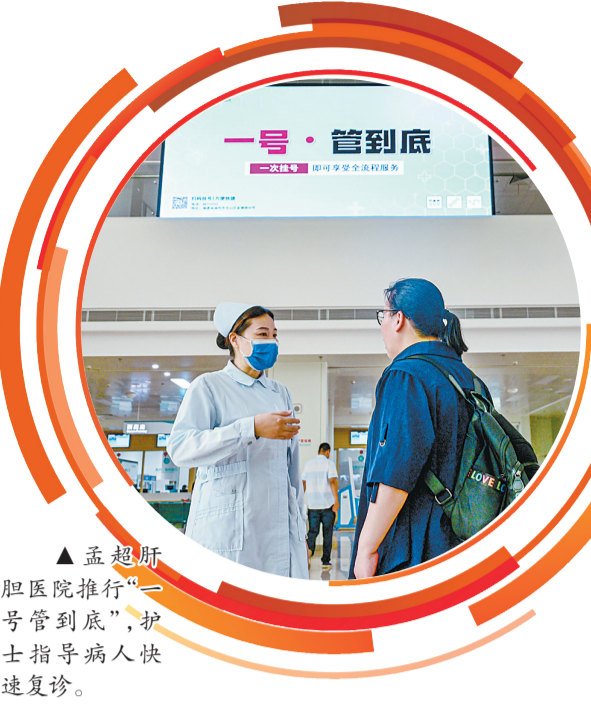
▲孟超肝胆医院推行“一号管到底”，护士指导病人快速复诊。