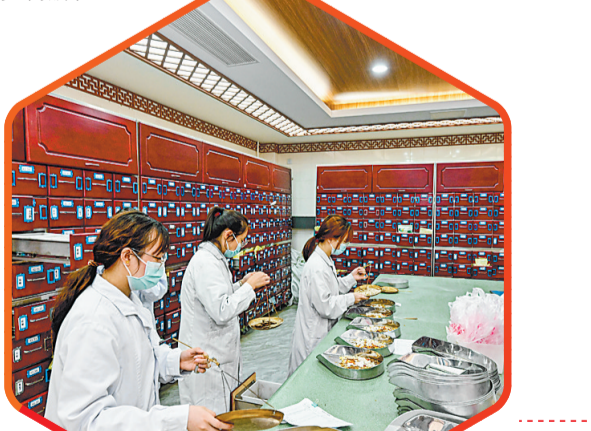
福清市中医院共享中药房终端内,医护人员根据药方抓药。

数据是最好的证明。市卫健委数据显示,今年上半年全市县域内住院量占比、基层诊疗量占比分别较上年同期增长3.8个百分点、3.2个百分点,切实推动“看大病在本省解决,一般的病在市县解决,日常的头疼脑热在乡村解决”。