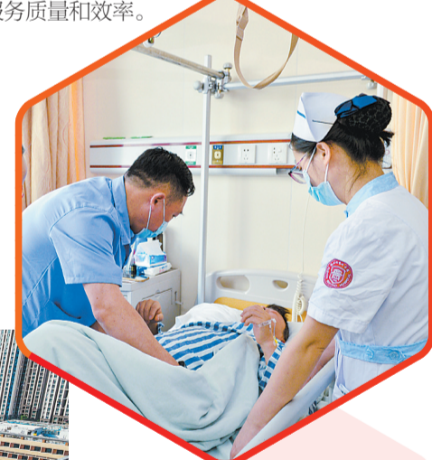
福州市第二总医院“无陪护”病房内,护士正在照顾病人。

——面对患者多跑路、常迷路,福州试点推广“一站式综合服务中心”,将过去分散在医院各处的“住院服务中心”“医政服务中心”“客服中心”“咨询台”等职能部门全面整合在一起,通过梳理简化服务流程,让几乎所有需要盖章的业务,都可以在综合服务中心这个窗口办理,免去患者奔波之苦,提升了服务质量和效率。