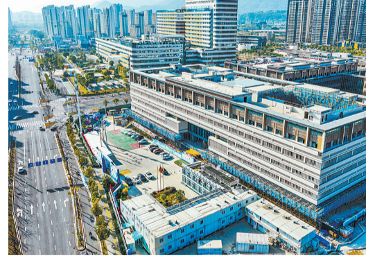
福州市中医院五四北院区(在建)。