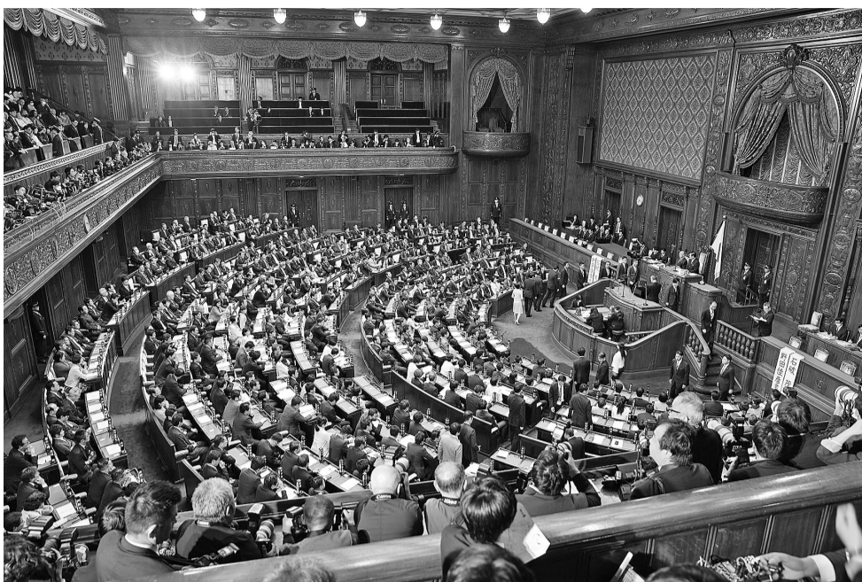
11月11日在日本东京拍摄的日本国会众议院会议现场。

在10月27日举行的众议院选举中,自公执政联盟议席数大幅下滑至215席,未达到过半数所需的233席。根据相关规则,首相指名选举众参两院的投票结果中,众议院投票结果具有优先地位。因此理论上讲,只要在野党能在众议院形成有效合力,就有可能实现“政权更替”。