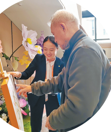
▲泰康之家·福园迎来首批居民。