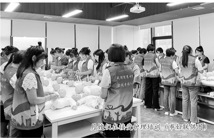
月嫂们在接受护理培训。

月嫂,这一过去以中老年妇女为主的行业,如今涌入了大批年轻的高学历女性。这些30多岁、有文化的月嫂不仅具有专业技能,还有年轻人的热情和创新精神,为母婴护理行业带来了新鲜活力。记者从市妇联获悉,今年7月启用的福州市海峡家政服务中心吸引业内知名的女王智慧月嫂公司加入。该公司此前吸收了14名大专和本科学历年轻女性参与专业培训并领取执业资格,目前已全部顺利上岗。值得一提的是,几名“85后”本科毕业的月嫂还被“抢”到全国各地就业,月薪从1.68万元至1.98万元不等。让我们一起来听听她们的故事。