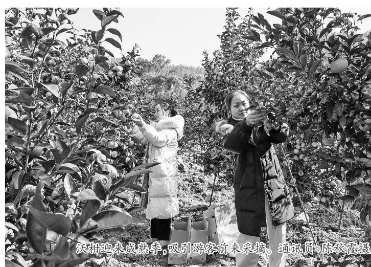
沃柑迎来成熟季,吸引游客前来采摘。

“我们种植的沃柑是从云南与福建漳州引进的优良品种,该品种色泽金黄透亮,皮薄、汁多、甜度好,近两年市场反响非常好。今年产量大幅提升,合作社计划开启‘农业+旅游’模式,大面积开放采摘游,吸引周边地区的游客前来采摘,并进村旅游。同时,我们还将为前来采摘的游客提供鸭肉粉干、锅边糊、炸油饼等当地农家特色美食,提升大家的采摘和游玩体验。”范体水说。