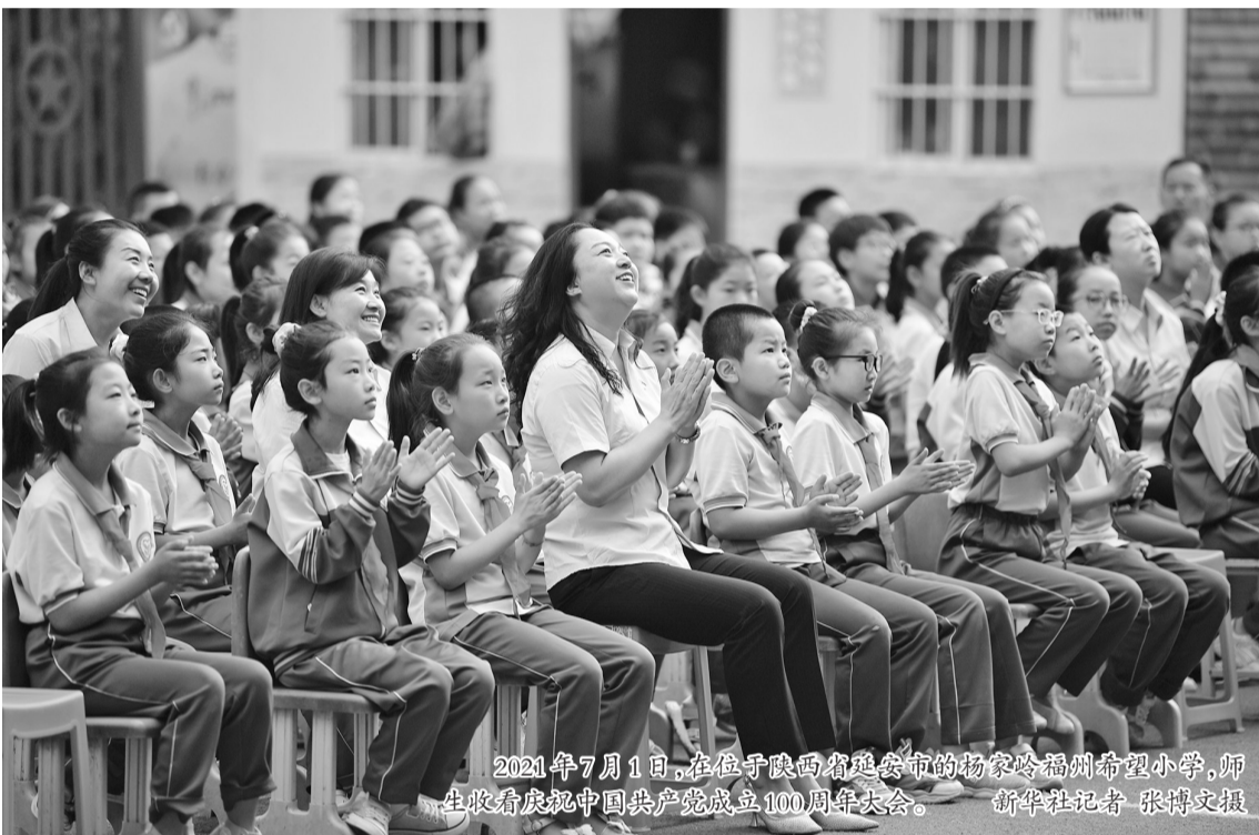
2021年7月1日,在位于陕西省延安市的杨家岭福州希望小学,师生收看庆祝中国共产党100周年大会。