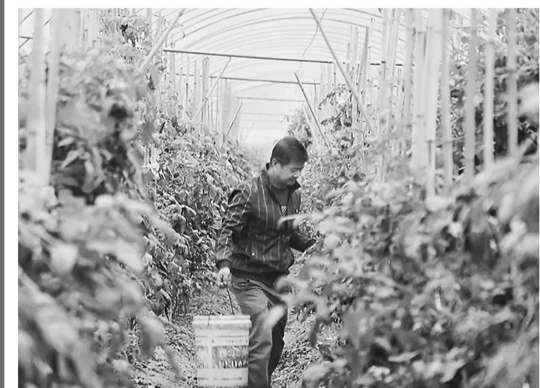
种植户在西红柿大棚内忙碌。

眼下已入冬季,但在永泰县清凉镇小田村的雨兰农业专业合作社蔬菜基地却呈现出一派绿意盎然的景象,一座座温室大棚整齐排列,棚内外的蔬菜成方连片、长势喜人,工人们正忙着采收着新鲜成熟的蔬菜,随后装车运送,销往市场。