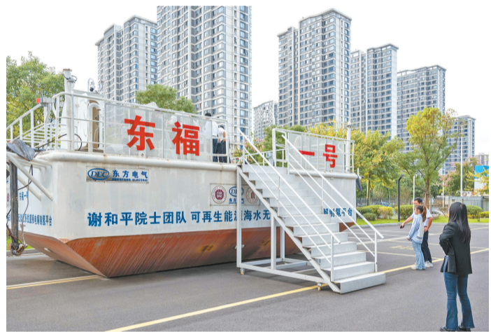
全球首套与可再生能源相结合的漂浮式海上制氢平台“东福一号”。

回望来时路,满怀豪情;展望新征程,更添信心。作为国家级高新区“第一方阵”,福州高新区因改革而生、因创新而兴。眼下,园区正全力打造全省创新发展策源地,着力打造新质生产力培育主阵地、成果转化首选地、青年人才集聚地,为全省、全市经济发展贡献更大的高新力量。