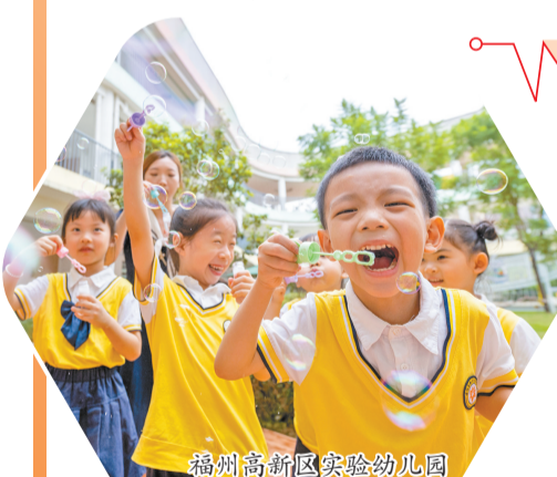
福州高新区实验幼儿园内,孩子们快乐玩耍(资料图)。

对过去最好的致敬,就是用奋斗书写当下、用拼搏开创未来。站在新的历史起点,福州高新区正以厚积薄发的姿态阔步向前,以民生为底色,开启改革再出发的奋进新征程。