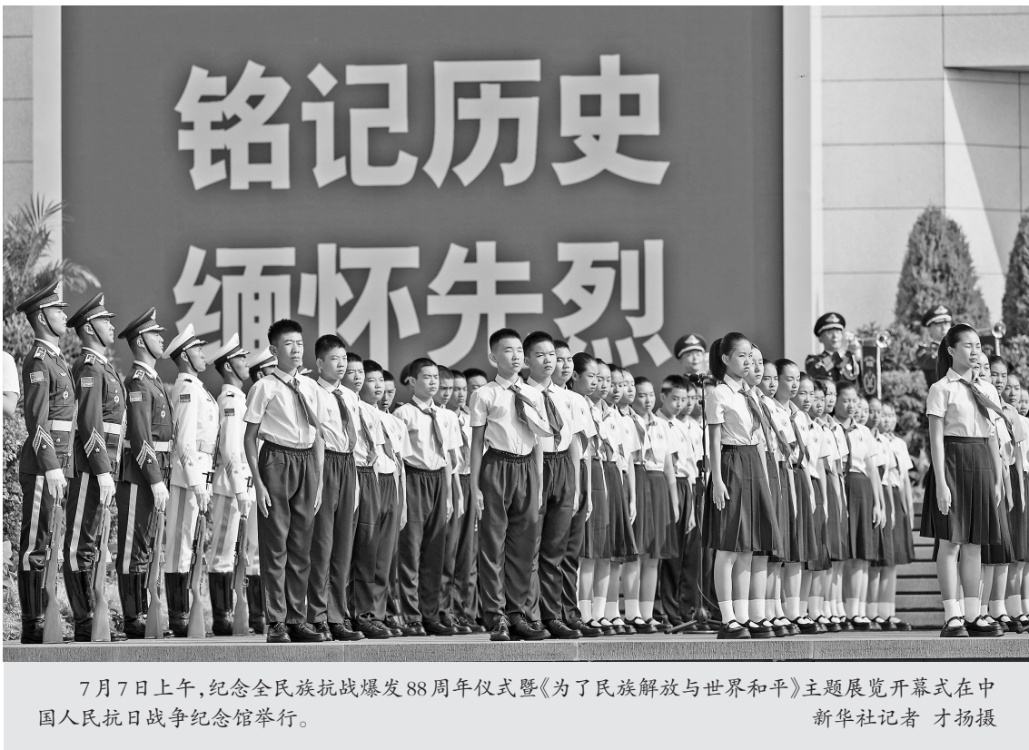
7月7日上午,纪念全民族抗战爆发88周年仪式暨《为了民族解放与世界和平》主题展览开幕式在中国人民抗日战争纪念馆举行。

新华社北京7月7日电 纪念全民族抗战爆发88周年仪式暨《为了民族解放与世界和平》主题展览开幕式7日上午在中国人民抗日战争纪念馆举行。中共中央政治局常委,中央书记处书记蔡奇发表讲话并宣布展览开幕。 北京卢沟桥畔,中国人民抗日战争纪念馆庄严肃穆。上午9时,仪式开始。中国人民解放军军乐团奏响《义勇军进行曲》,全场高唱中华人民共和国国歌。随后,全场肃立,向在中国人民抗日战争中英勇牺牲的烈士默哀。 蔡奇在讲话中指出,88年前的今天,日本军国主义蓄意制造震惊中外的卢沟桥事变,悍然发动全面侵华战争。中国军民奋起抵抗,全民族抗战爆发,并开辟了世界反法西斯战争的东方主战场。中国共产党勇敢战斗在抗日战争最前线,引领中国抗战的前进方向,成为全民族抗战的中流砥柱,全体中华儿女前赴后继、勠力同心,为国家生存而战、为民族复兴而战、为人类正义而战,赢得了中国人民抗日战争的伟大胜利,为世界反法西斯战争胜利作出了重大贡献。在中国人民抗日战争暨世界反法西斯战争胜利80