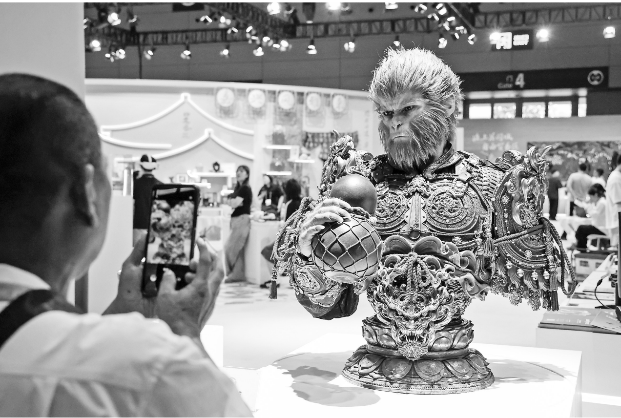
第二十一届中国(深圳)国际文化产业博览交易会,观众在拍摄黑神话悟空半身像。