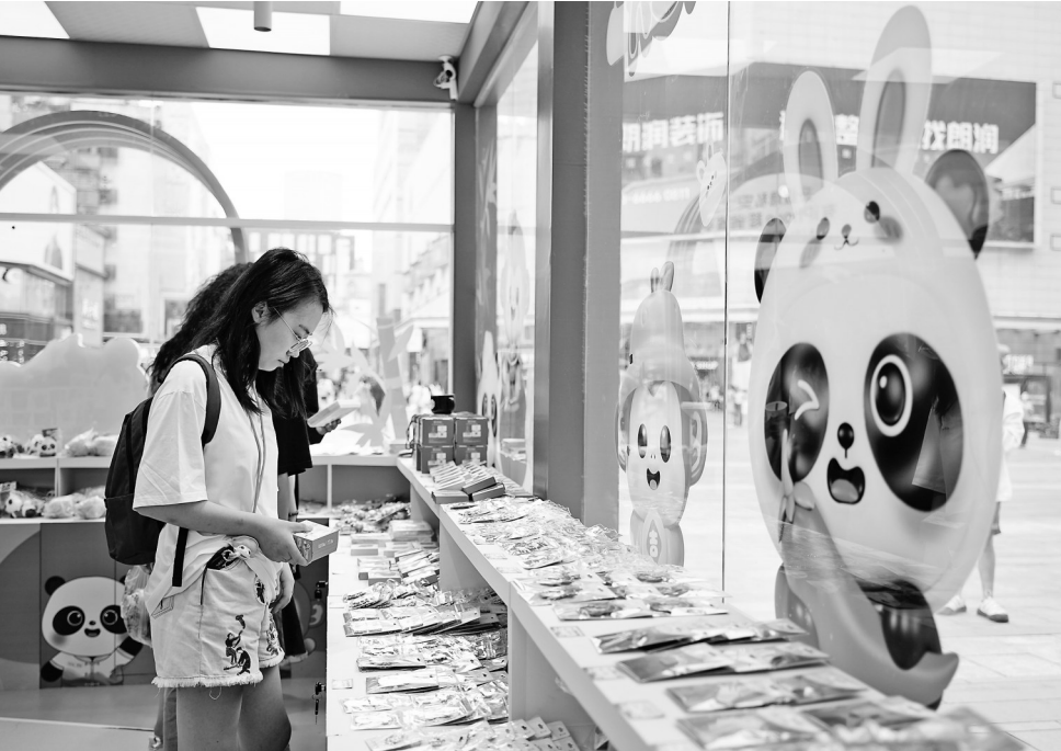
7月8日,顾客在位于成都春熙路的世运会官方特许商品零售店内选购商品。

今年3月,成都还启动了“爱成都·迎世运·动起来”世界运动会项目校园推广活动,在全市120所学校推广棍网球、飞盘、壁球等