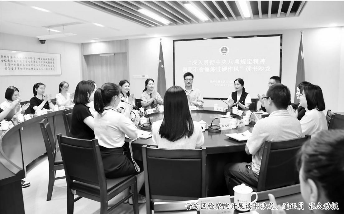
晋安区检察院开展读书沙龙。

2024年初,该院发布《深化“映象·晋检·2024”建设推进检察工作现代化实施方案》,将党建任务细化为41个项目,明确责任部门、压实推进节点,确保任务清单化、项目化、可视化。