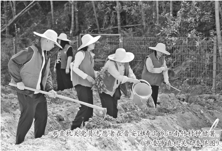
市直机关党员志愿者在晋安区寿山乡江南竹村种甘薯。

江南竹村自2022年与省、市机关单位开展“我在乡间有亩田”认筹认种共建活动以来,村民增收了,村里的耕地盘活了,党员志愿者也可以买到放心的农产品。