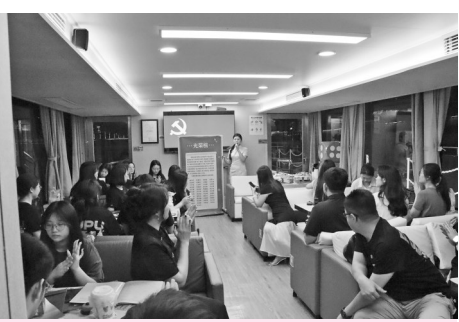
青年人才参加“才聚台江·交友日”活动。

主办方有关负责人介绍,此次活动不仅为青年人才搭建了一个别开生面的交流平台,更通过创新形式,让红色文化在青年人才心中生根发芽,激发了青年人才的爱国热情与奋斗精神。