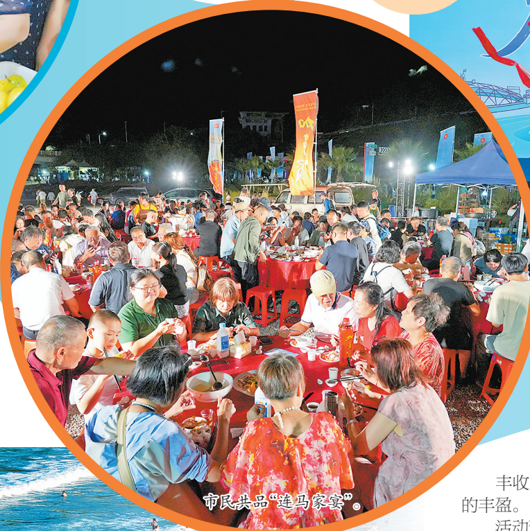
市民共品“连马家宴”。