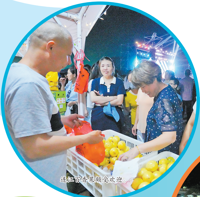
连江百香果颇受欢迎。

农业兴,农民富。今年上半年,福州农村居民人均可支配收入18214元,比上年同期增长6.2%,福州农民的“钱袋子”越来越鼓。