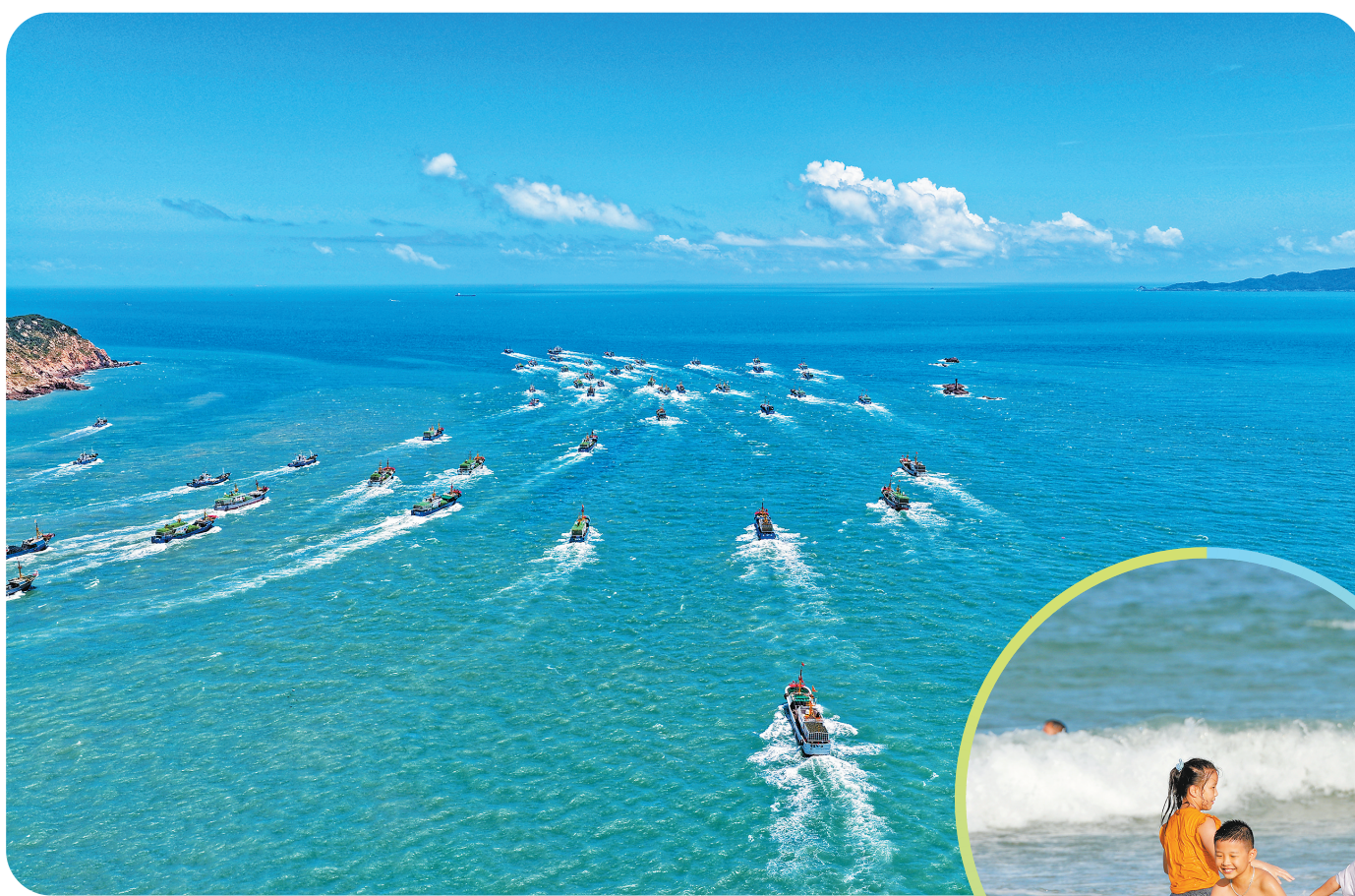
千帆竞发，开启新一轮的「耕海牧渔」。

从千帆竞发的壮阔,到硕果盈枝的甜美,这份丰收的喜悦在连江的山海间洋溢,更在福州高质量发展宏伟蓝图上留下浓墨重彩的一笔。数据显示,今年上半年,全市一产增加值达 298.53 亿元,增长 4.4%,增速高居全省第一,且高于全省平均水平 1.1 个百分点。同时,农林牧渔业总产值实现 515.32 亿元,比增 4.3%,增速同样位居全省首位,高于全省平均水平 1 个百分点。