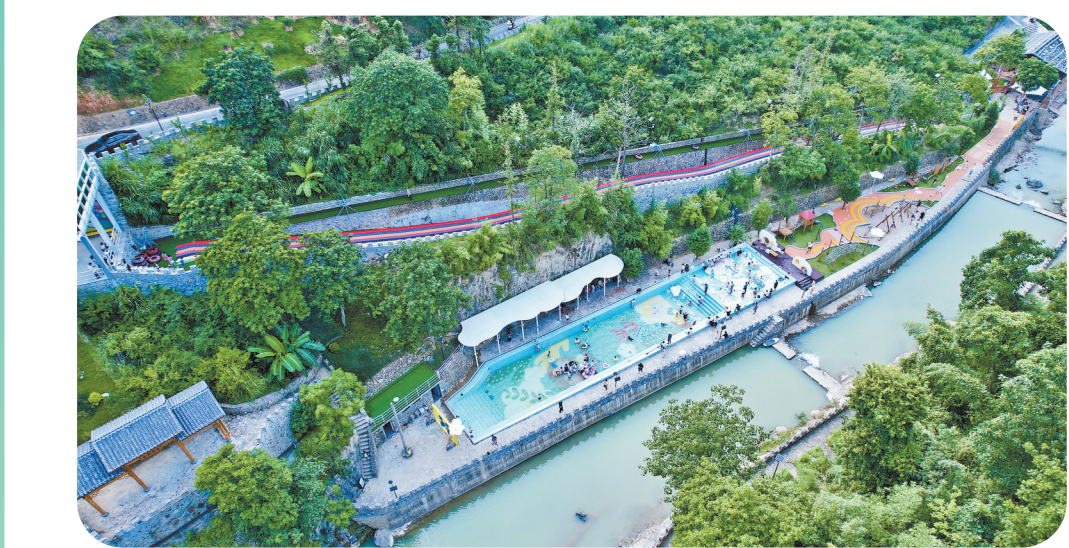
溪源村沿溪打造文旅项目。

“溪源裡最大的特色,就在于它是‘村民主导’的景区。投资主体是村集体,项目规划也由村民共商共绘。”溪源村相关负责人介绍,近年来,依托“党建引领+集体入股+公司开发+专业运营”新模式,村股份经济合作社以资产评估入股,占股51%,村民全员成了大股东;乡贤及社会资本等占股49%,联合成立福建闽清溪源裡旅游有限公司,共同开发景区一期。