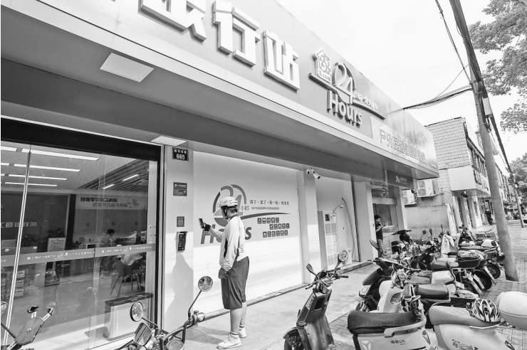
8月26日,外卖骑手在嘉兴南湖区越秀集市扫码进入24小时工会驿站(嘉工驿站工商银行站)。

今年1月,中央社会工作部等八部门发文加强快递员、网约配送员服务管理,将推进友好场景建设