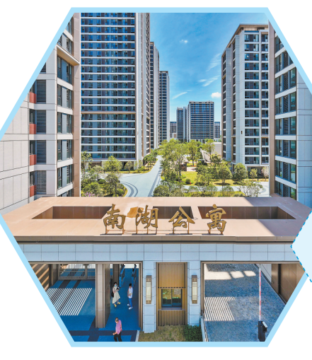
南湖公寓项目正在进行收尾工作,即将投用。

【高新经验】 项目是经济发展的“生命线”,招商是产业升级的“动力源”。保利通信高新科技产业园依托保利央企优势,以“创链、强链、补链”为目标,重点引进5G通信、智能制造、电子信息、医疗健康、数字金融等高新科技项目,为我市壮大“工业树”、繁茂“产业林”带来累累硕果,战略性新兴产业聚势成链。 今年,福州高新区持续深化“奋勇争先”行动,重点围绕光电、生物医药、低空经济、人工智能、新能源、新材料等重点产业和战略性新兴产业、未来产业展开招商工作,灵活运用16项176条招商政策,用好载体招商、基金招商、产业链招商、以商招商、订单招商等行之有效的模式,加快做大做强优势产业集群,扩大倍增效应,成功入选省级数字经济产业集聚区、福建省中小企业特色产业集群。 产业链发展壮大还离不开政府部门持续优化营商环境,近年来,福州高新区着力创新体制机制,统筹推进产业链、创新链、人才链、资金链、服务链“五链”融合,为区域产业高质量发展注入强劲动能。 “气温”适宜,“阳光”“空气”“水分”充足,“工业树”“产业林”就会枝繁叶茂,结出累累硕果。依托于完善的政策扶持体系、高效的政务服务机制,以及优质的产业配套资源,福州高新区已初步形成以数字经济为核心,光电、生物医药产业为支柱,现代服务业为支撑,低空经济等“X”个战略性新兴产业和未来产业蓬勃发展的“121X”产业格局。通过创新驱动、产城融合,福州高新区正成为连接海峡两岸、具有竞争力和影响力的科技创新中心,凭借完善的创新生态,为企业成长赋能,推动区域经济高质量发展。