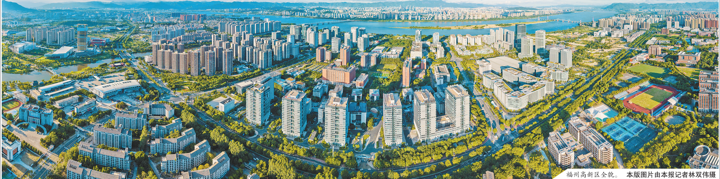
福州高新区全貌。

【高新经验】 人才聚,则事业兴。多年来,福州高新区积极推进人才公寓建设,通过优化公寓环境、升级基础设施、提供暖心服务等措施,不断为辖区人才打造美好生活,让他们住得安心、舒心、放心。 在优化人才引育留用机制方面,福州高新区的工作走在全市前列。园区创新出台了《福州高新区高层次人才认定和支持办法(试行)》《关于鼓励引进高层次人才八条措施》等政策,涵盖了人才激励、创业扶持、成果转化、住房保障等各方面共15项127条,形成较为完善且具有高新区特色的“1+1+N”人才政策体系。 以创新人才为核心、五链融合为路径,今年以来,福州高新区承办“好年华 聚福州”线上线下招聘会等活动30多场,共有3000余家企业参加,提供岗位近2万多个,涵盖2000多种岗位类型,投递个人简历10500份,超5000名毕业生与用人单位达成初步就业意向。先后与福建师范大学、福建工程学院、福州职业技术学院等高校开展“访企拓岗促就业”活动,签订校地人才合作协议,建立全面、长期、稳定的人才输送合作关系,一次又一次“城”与“人”的双向奔赴精彩上演。 聚焦创业扶持、人才政策落地及两岸人才融合等重点领域,福州高新区稳步推进人才工作。截至今年8月,累计服务人才超5000人次,发放各类补贴超2000万元,新增各类高层次人才认定104人,人才公寓入住率达75.3%。全区累计引进(含合作)院士32人、国家级重大人才计划25人、国务院特殊津贴8人。 在福州高新区,越来越多的“人才活水”汩汩涌流,越来越多的创新成果竞相迸发。