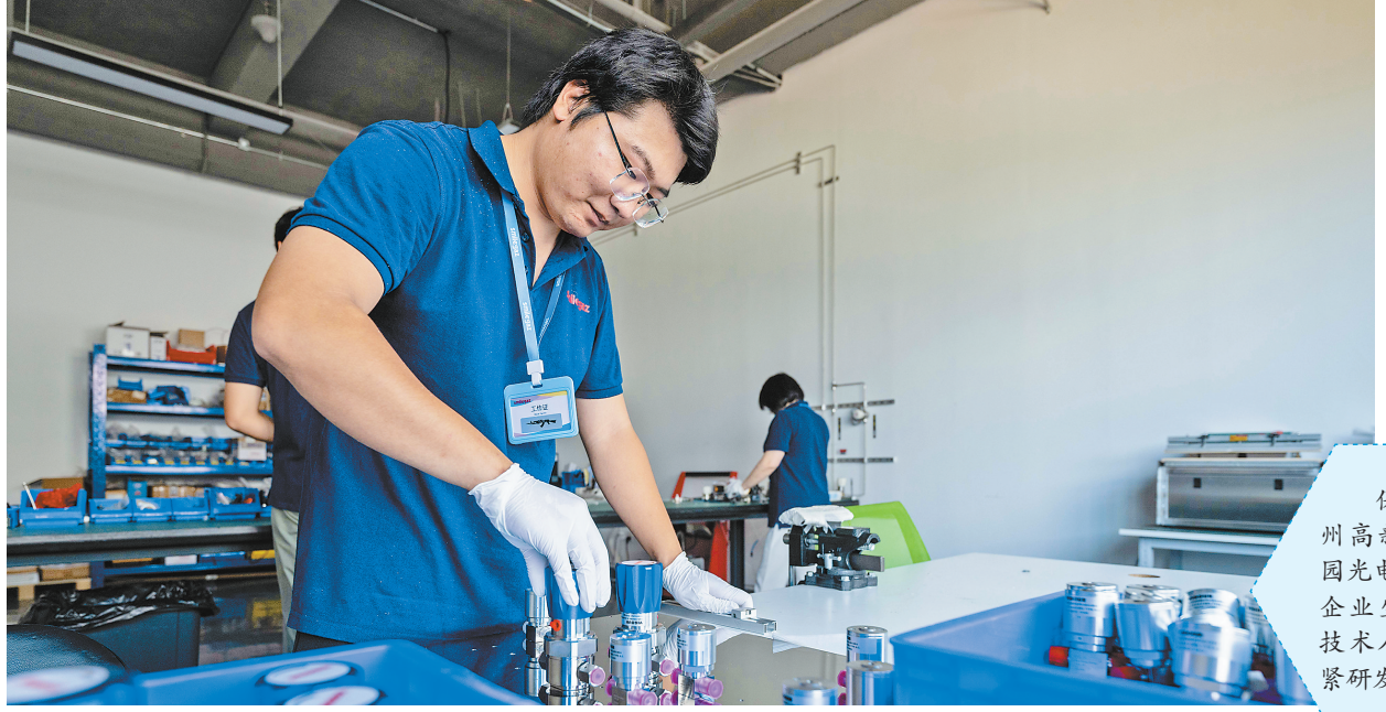
保利通信福州高新科技产业园光电企业集聚,企业生产车间内技术人员正在加紧研发产品。

【一线直击】 保利通信福州高新科技产业园坐落在福州高新区两园片区的核心区,位于智慧大道与尧溪路交会处,项目总投资约20亿元,总占地面积约123亩,总建筑面积约25万平方米,分A、B区开发建设。重点引进5G光电、智能制造、电子信息、新能源等高新科技企业。 该项目于2022年10月21日土地摘牌,通过“并联审批、并联验收”,做到土地摘牌即开工、竣工即交付,开工和竣工时间均比土地出让合同约定条款提前15个月,开创了产业园行业的“高新速度”。目前,产业园A区15万平方米已于2025年初投产,B区10万平方米已全部落架,正在进行公区装修和市政景观施工,计划2025年底投用。 智慧化的花箱道闸、现代感的建筑立面、环绕园区的背景音乐、唯美流动的线束喷泉……走进园区,迎面扑来的科技感和现代感让人耳目一新。除了直观可见的品质标准与管理细节,园区在配套服务层面同样发力,打造出总面积约5300平方米的产业服务中心,配备食堂、健身房、共享书吧、休闲茶室等服务空间,集产业、运营、生活、服务于一体,一站式满足入园企业和员工的各项需求。 以技术创新夯实运营管理核心竞争力,园区不断释放智慧效能:新科技和多项设计专利,大大提升了园区运营管理的效率。保利通信(福建)有限公司董事长曾仁武介绍,园区配备1000个探头及监测传感器,对日常运维、安防联动、综合管理、招商运营、能源监控等各项数据实现精准采集,数据实时传输至园区运营平台的智慧大脑,进而实现分析预警、联动可视,提升了园区安全性和管理效率,为园区的可持续发展提供强有力的支持。 同时,园区为企业提供了证件代办、政企协调、法务服务、税务咨询、企业家成长、产品推广、人才服务、金融服务、科技服务等不同阶段、全生命周期的“保姆式服务”,全方位助力企业健康快速发展。 目前,保利通信福州高新科技产业园已引进深圳芯锋科技、青岛芯笙科技、创芯微科技、光旭科技、威泰思光电、优恩立光电、百晶光电、显新科技、三立电子、伟亿科技、派利德科技等国家高新技术企业26家,其中已投产22家,投产率达85%,新增就业人数超过1500人,纳税超5000万元,园区正以建设福建省标杆科技产业园为目标,强化创新资源集聚,努力打造区域科创发展的新引擎。