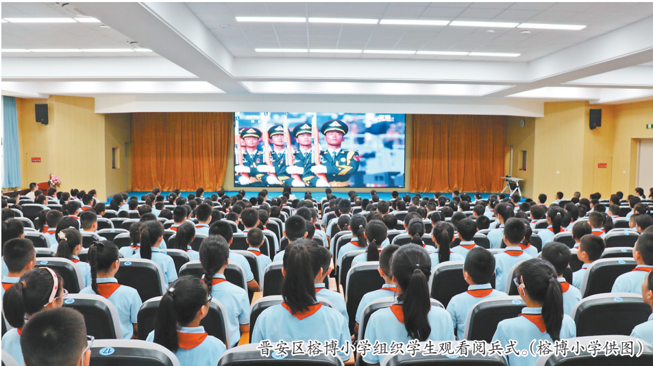
晋安区榕博小学组织学生观看阅兵式。