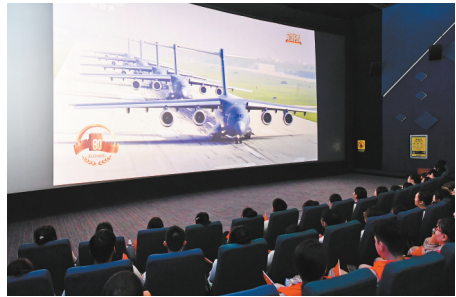
市民在影院观看阅兵直播。

本报讯(记者 林晗)全场观众激动地挥舞红旗,现场数次响起欢呼声和掌声……昨日上午,金逸影城IMAX(万宝商圈店)、万象影城福州万象城HALO巨幕店两家影院通过4K超高清信号卫星传输,同步直播纪念中国人民抗日战争暨世界反法西斯战争胜利80周年大会。