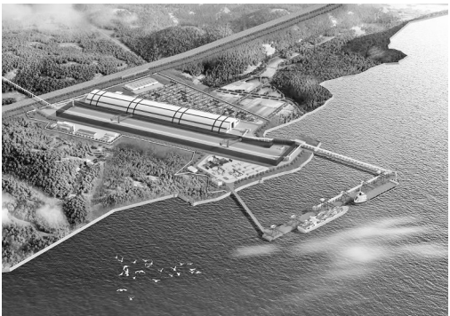
福州港罗源湾港区可门作业区15-17号泊位工程项目效果图。

本报讯(记者 任思言 通讯员 唐飞)近日,福建省发展和改革委员会正式核准批复福州港罗源湾港区可门作业区15-17号泊位工程项目。