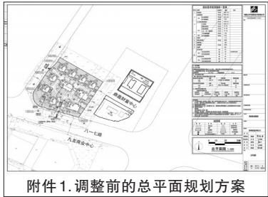
附件1. 调整前的总平面规划方案

在公示期限内，利害关系人若有意见，可来电或来信向我局建筑与市政科反映(联系电话：83689254)。