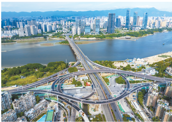
金山大道西互通立交。

这个假期,除了通行“喜报”,一场紧锣密鼓的攻坚战也吹响号角。除了加速展开金山大桥西互通立交剩余非机动车匝道建设,金山大道主线高架桥建设也在有序推进。国庆中秋假期恰逢施工黄金期,200多名施工管理人员驻扎一线,重点展开主线桥桥墩路侧钢箱梁与预制小箱梁的吊装作业。