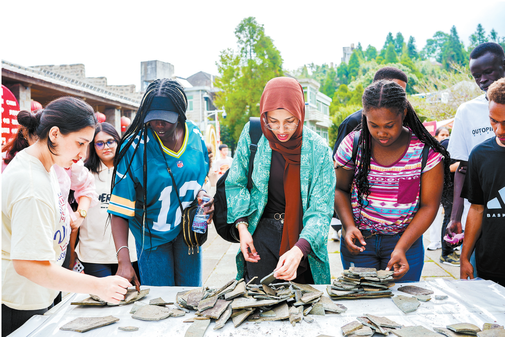
留学生在鼓岭体验摆塔习俗。

如果说鼓岭是一部记录中西交流的生态史诗,那么有着“千年碑林”之称的鼓山就是流量担当,自古就是福州人登高