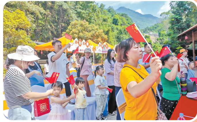
▲商家纷纷自发悬挂五星红旗,营造节日氛围。