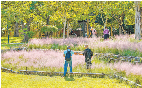
个别游客为追求拍照效果,直接踩入花丛,导致花草倒伏。

本报讯(记者 燕晓)国庆中秋假期,福州赤桥公园的粉黛乱子草进入盛花期,成片粉色花海吸引众多游客前来打卡。然而,这片美景却因部分游客的不文明行为而遭受破坏。