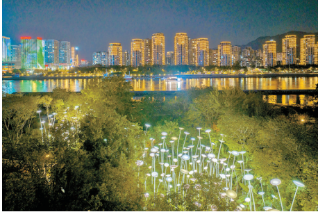
花海公园新增“金针菇灯”。

本报讯(记者 石磊磊)今年国庆中秋长假,不少市民游客选择夜游福州,感受高温褪去后的流光溢彩。记者从闽江公园管理处了解到,为了扮靓闽江沿线夜景,福州花海公园夜景系统升级,400多盏瓦楞灯带来全新的花瓣灯组,被游客们称作“金针菇”灯,不仅解锁了全新的游园打卡方式,还给闽江夜游增加了灵动和魅力。