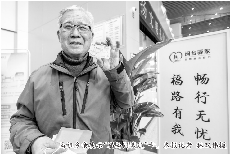
马祖乡亲展示“福马同城通”卡。