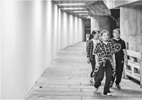
下穿通道内完善了照明系统。

本报讯(记者 孙漫)记者昨日从福州城投集团所属市城乡建总了解到,经系统提升,闽江北岸全线贯通提升工程闽水园下穿通道正式建成并投入使用。作为我市2025年度重点为民办实事项目,新通道开放通行,让市民的沿江出行更安全更顺畅。