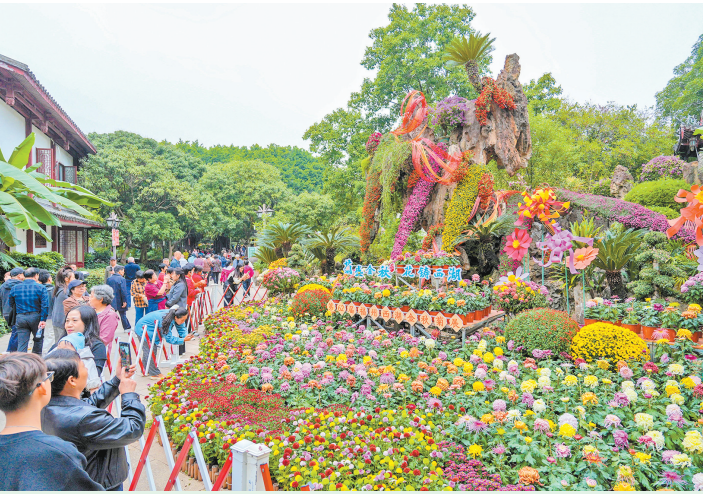
市民游客在西湖公园观赏菊花。