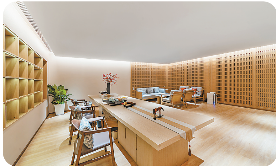
新投海瑜酒店茶室。