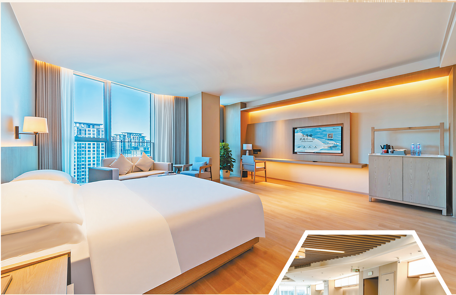
新投海瑜酒店客房。