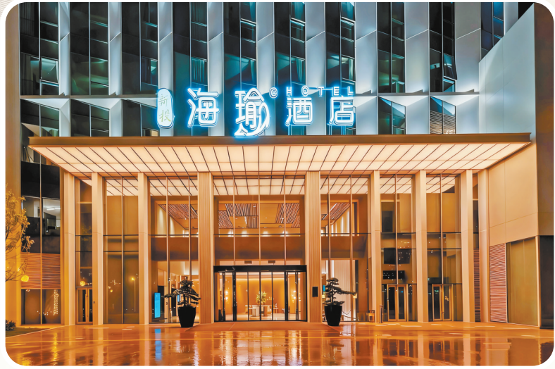
新投海瑜酒店外景。