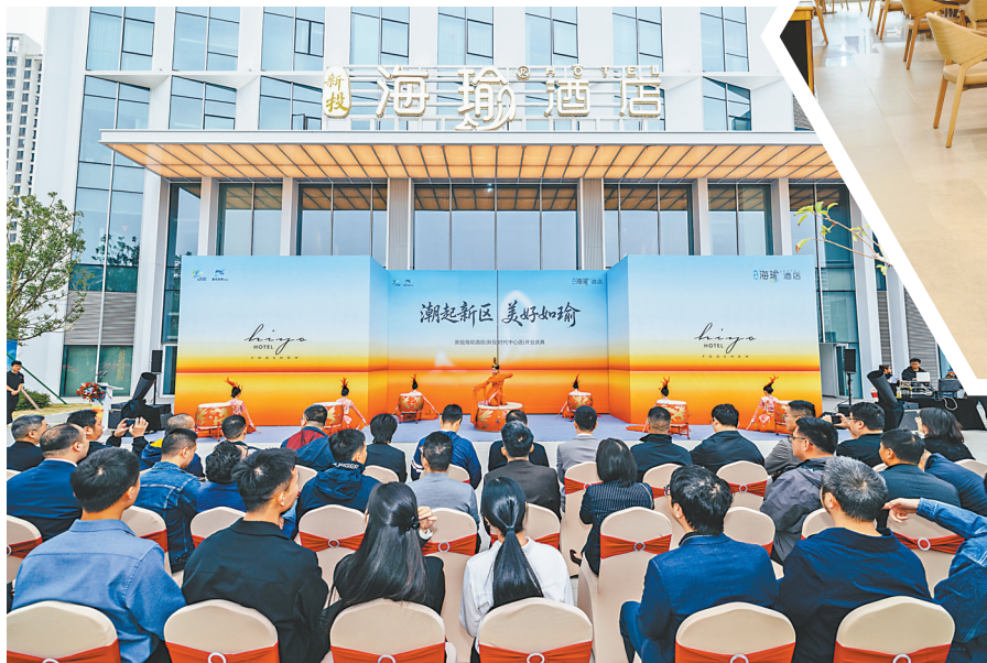
新投海瑜酒店开业现场。

2025年11月3日开业的新投海瑜酒店,作为福州新区集团自主品牌酒店,标志着其在酒店业务领域实现从“合作运营”到“自主品牌”的战略跨越。该项目不仅是新投海瑜公寓管理有限公司多年运营经验的集成与提升,也是集团构建“会展+文旅+住宿”一体化服务生态的关键落子。据了解,除本次开业项目外,福州新区集团正积极推进包括福州火车南站、福米产业园区在内的多个酒店项目,预示着新区酒店业务板块正步入体系化、品牌化发展的新阶段。