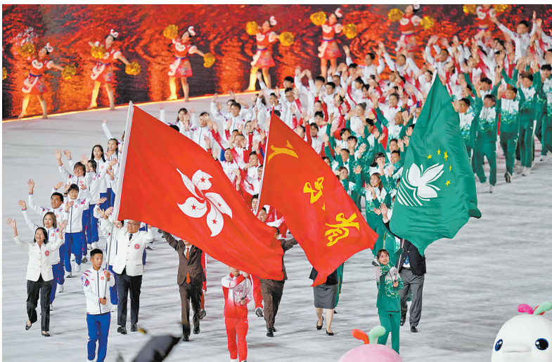
11月9日,广东省体育代表团、香港特别行政区体育代表团和澳门特别行政区体育代表团在入场仪式上共同入场。