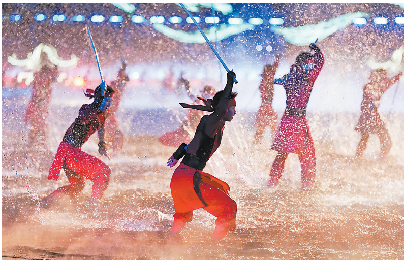
开幕式现场表演。