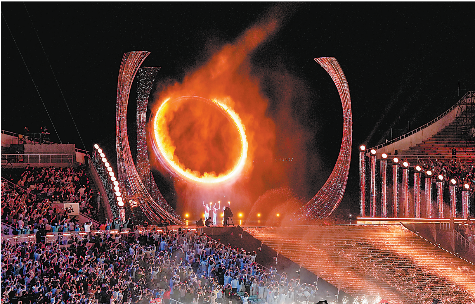
11月9日,第十五届全国运动会主火炬被点燃。

新华社广州11月9日电(记者 赵紫羽 田宇)第十五届全国运动会9日晚在广东奥林匹克体育中心开幕。以《圆梦未来》为主题的文体展演讲述了粤港澳大湾区从千年历史走向未来发展的壮阔历程。主创团队在开幕式结束后的新闻发布会上表示,从空间叙事、艺术表达再到最后三地运动员共同点燃主火炬,开幕式处处体现着粤港澳文化交融。