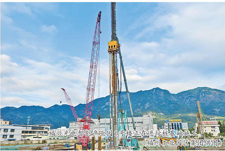
福兴光电智创产业园1号楼正在进行桩基础施工。

“‘早期介入’和‘强干预’,是定制厂房与标准厂房的核心区别。”福兴经济开发区管委会相关负责人表示,定制化会带来园区建造成本的微增,但企业因此免去入驻后“伤筋动骨”的改造,交付后能