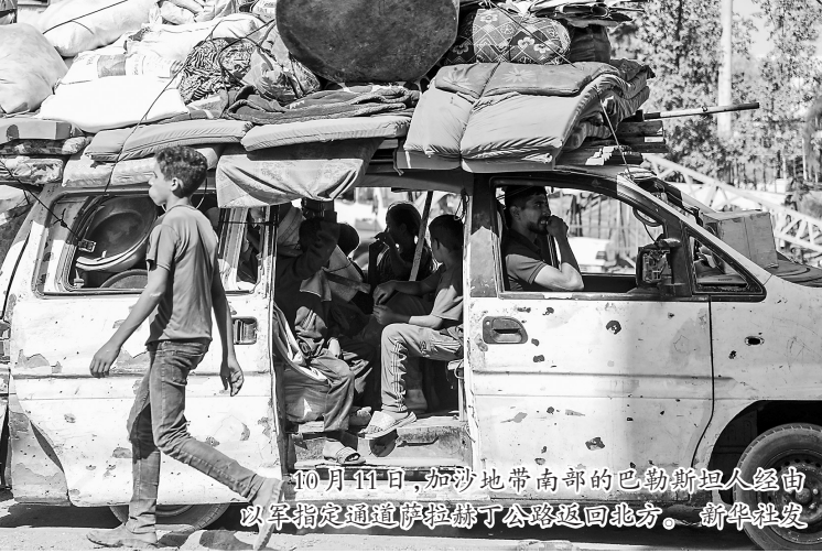
10月11日,加沙地带南部的巴勒斯坦人经由以军指定通道撤离回了公路返回北方。

分析人士认为,在冲突和争议背后,是哈马斯与以色列之间根深蒂固的互不信任。埃及赫瓦尔政治与媒体研究中心主任艾哈迈德·塔希尔说,哈马斯认为以色列过去经常背弃承诺,因此始终怀疑其是否愿遵守停火协议,以军在停火生效后屡次发动袭击更加深了这种