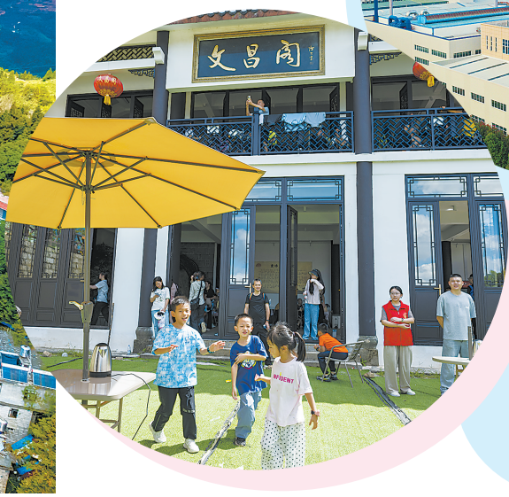
思嘉工业园。