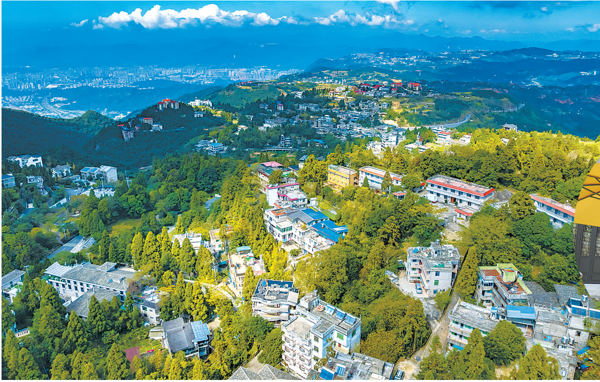
俯瞰宦溪乡村新貌。

承载能力持续攀升。全镇国土空间规划新增产业用地近3000亩，投资5000万元完善园区生活配套设施，建成“云上宦溪”露营地、“厝里·墅”民宿等文旅项目。2024年，园区新增员工公寓2万平方米，引进品牌便利店、银行网点等生活服务设施，产城融合的图景愈发清晰，工业的“硬支撑”与生态的“软实力”在这里相得益彰。