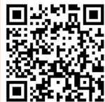
扫描了解 更多信息

第十五届全运会的辉煌已成过往，这份荣光也属于每日在训练场上流泪流汗的孩子，属于闽江畔每一个被冠军故事激励的少年。它所激发的斗志和积累的经验，正转化为福州体育人迈向新征程的强大动力。坚持“3820”战略工程思想精髓，福州竞技体育必将在未来的赛场上继续奋勇争先，为体育强国建设贡献更多的福州力量。