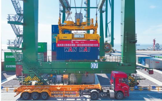
集装箱海铁联运一体化直卸业务。

本报讯(记者 吴梓真 通讯员 陈超越 姚维佳)记者昨日从福建省福州港口发展中心获悉，截至11月21日，福州港江阴港区集装箱海铁联运一体化直卸进港业务累计突破100列，为江阴港区打造区域集装箱海铁联运枢纽注入强劲动力。