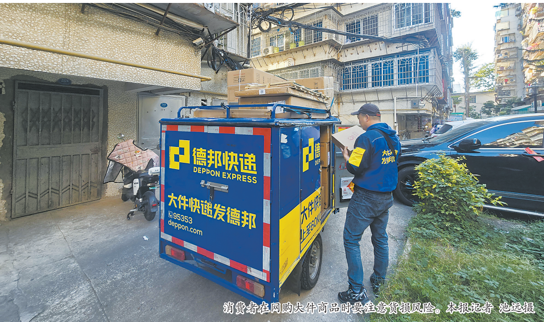
消费者在网购大件商品时要注意货损风险。

晋安法院法官介绍，消费者在网购时，务必保存好平台订单截图、与商家的聊天记录、转账或付款凭证，作为维权的核心证据；若商家不发货或货不对板，可先联系平台客服介入调解，督促商家履约，并要求平台披露商家具体信息；调解无果时，也可向商家所在地市场监督管理局投诉，借助行政力量解决。