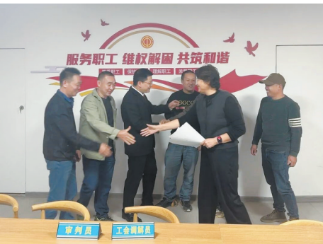
双方达成圆满调解结果。通讯员 何望琴摄

经过耐心疏导与法院的专业指导，企业与职工最终摒弃对立情绪，达成一致意见。企业同意一次性支付相关费用，劳资矛盾得以高效化解。