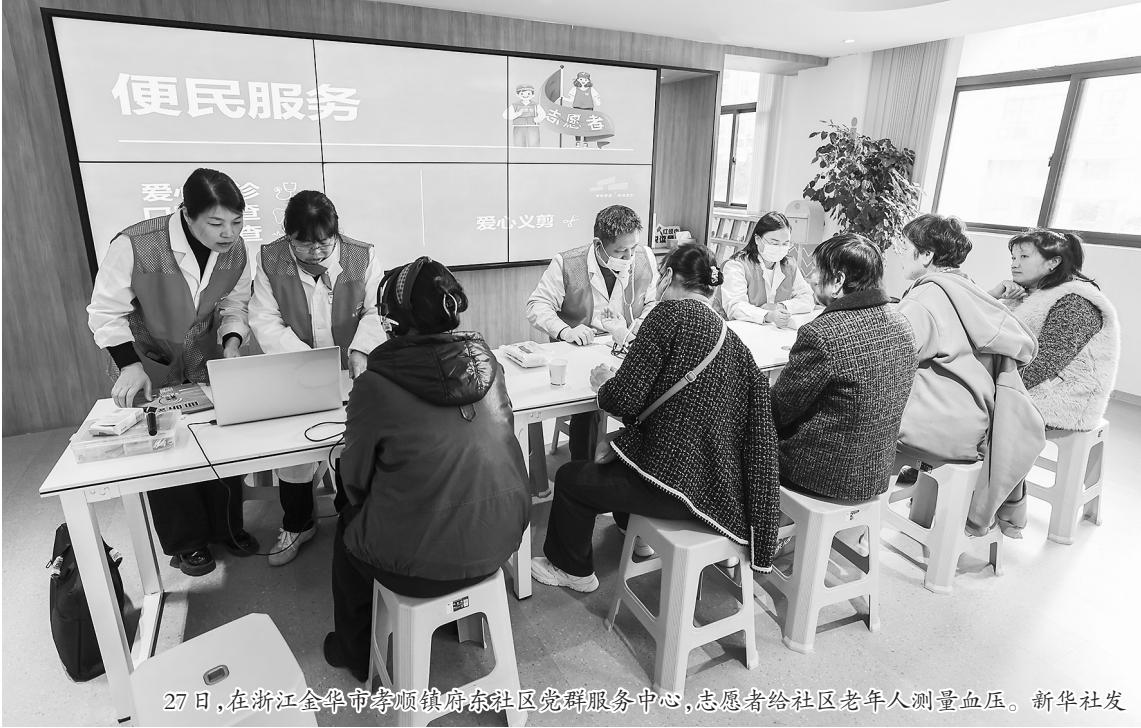
27日,在浙江金华市李垌镇府东社区党群服务中心,志愿者给社区老年人测量血压。

2024年4月,《中共中央办公厅 国务院办公厅关于健全新时代志愿服务体系的意见》出台,成为系统部署健全新时代志愿服务体系的第一份中央文件,为志愿服务事业长远发展绘制了蓝图。