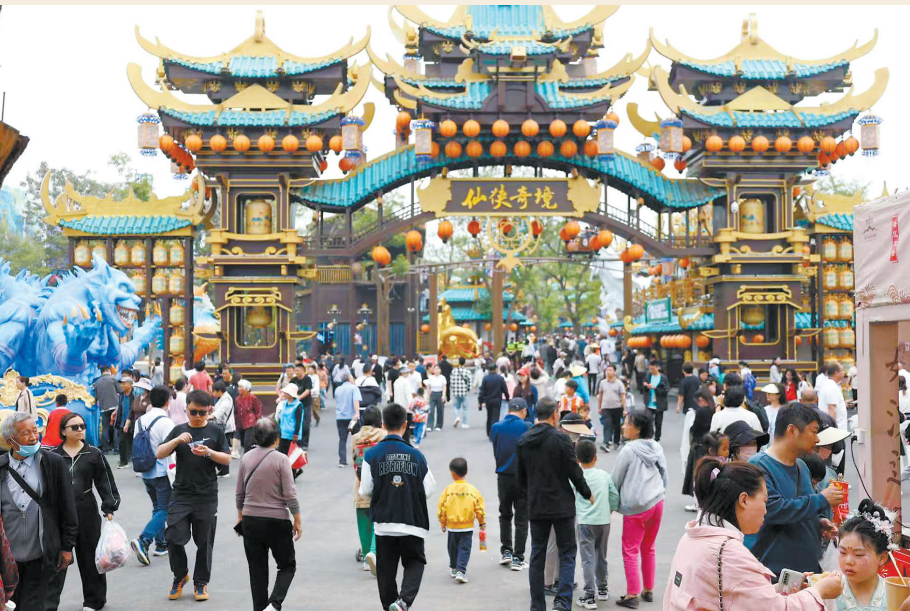
万岁山武侠城游人如织。

对福州的经验启示：立足全域文旅融合发展，打破景点壁垒，延伸消费链条，推出福州旅游年票，推动三坊七巷、闽江夜游、多维文旅演艺《最忆船政》、实景演出《寻梦闽都》等联动发展，开发闽剧元素、船政符号的“福州礼物”文创产品，形成“流量→留量→消费量”的转化闭环。