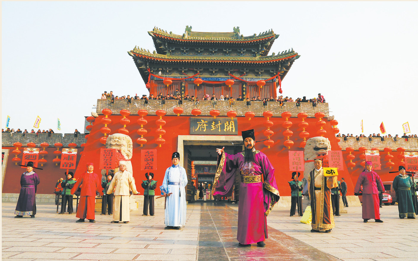
开封府景区开衙迎宾场景。

对福州的经验启示：借鉴开封“IP”活化思路，整合林则徐、沈葆楨、林徽因、吴石等名人资源，通过身份重构实现IP活化，打造沉浸式实景演出与研学线路，让历史人物从静态展示变为可互动的活态符号。传播上借鉴“民间创作+官方助推”模式，创造条件鼓励短视频创作者推出精品视频，官方筛选热门内容联动抖音、小红书精准推广，让闽都名人精神与文化魅力广泛传播。