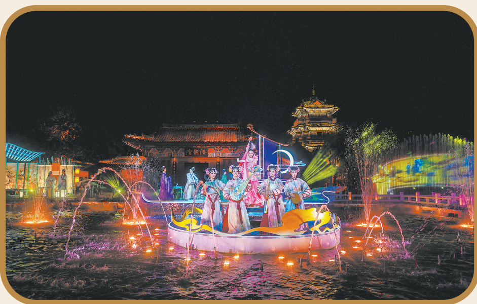
开封府《南衙千秋月》演出现场。