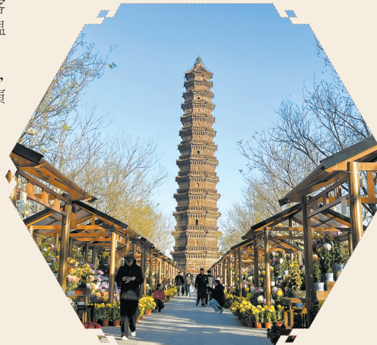
千年铁塔与菊韵交融。

对福州的经验启示：借鉴开封“全时段、全场景”沉浸思路，强化文化IP与场景、消费的绑定，进一步打造和完善爱心树等网红打卡点和消费场景，白天引导游客深度游览三坊七巷、烟台山、马尾船政文化城等主要景点，夜间通过闽江夜游融合明清主题灯光秀、闽剧演艺与闽菜福宴等，强化穿越式体验，让闽都文化可感可触。