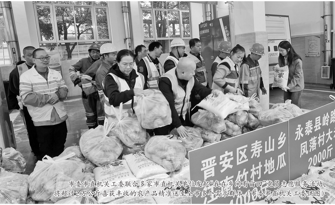
市委市直机关工委联合多家市直机关单位发起“我在乡间有亩田”党员志愿服务活动,将超过2万公斤喜获丰收的农产品精准送至全市多个需求群体。

昨日上午,甘肃临夏一间会议室里,一份跨越约2300公里的“礼物”——价值1000万元的“春蕾卫士”AI智能体项目及5万元专项公益资金进行了交接。该项目由福州市福延公益慈善服务中心联合福州爱心企业共同推动,旨在运用人工智能技术为当地校园构建起事前预警、事中干预、事后追溯的全链条科技防护网。