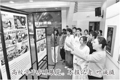
高校学子参观展览。

本报讯(记者 林格昇)10日,第四届侯官论坛系列活动之一——福建医科大学侯官文化AI艺术创作大赛作品展举办。展览以“侯官文化 智启未来”为主题,通过百余件融合历史底蕴与前沿科技的创意作品,全景式展现福建青年学子对侯官文化的创新性诠释,为优秀传统文化的实践注入青春力量。