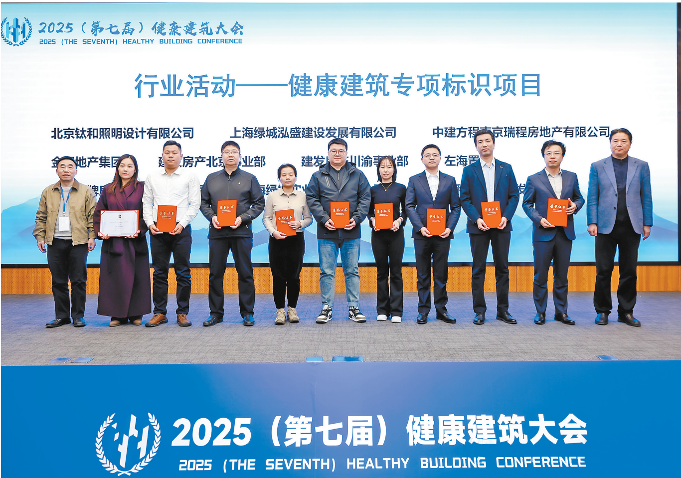
左海置地在大会上获得健康建筑专项标识。