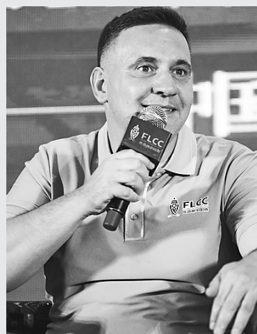
IFDA 总秘书长马西畅谈中国足球。