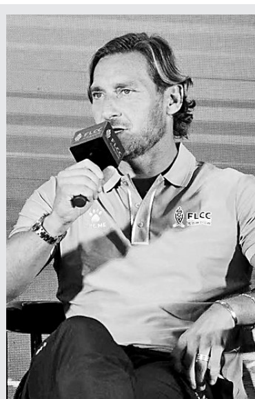
意大利球星托蒂回答球迷问题。

马西希望通过传奇杯万众瞩目的豪华明星阵容,翘首以盼的精彩比赛,让赛事成为中国球迷难得一遇的盛会。当世界足球文化汇聚一堂时,福州也必然成为中国足球连接世界不可或缺的纽带。最后,马西还打趣道:“我们知道福州有中国最好的茶叶,我太太交给我任务,一定要带很多很多茶叶回去!”