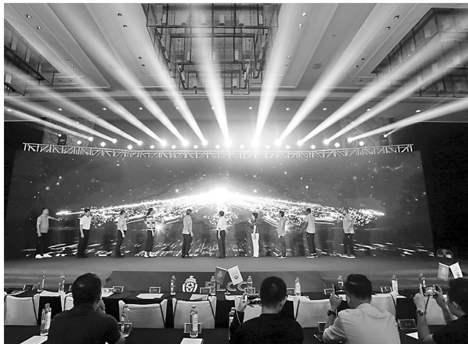
2020 传奇杯中国赛昨日在福州启动。