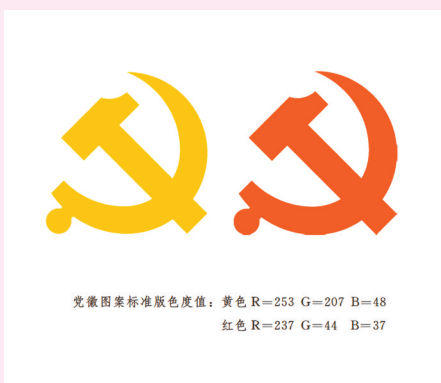
党徽图案标准颜色度值: 黄色 R=253 G=207 B=48 红色 R=237 G=44 B=37